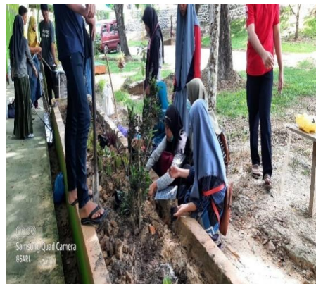
Mengenalkan kegiatan jumat bersih untuk membiasakan menjaga kebersihan lingkungan.