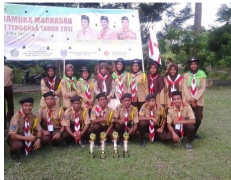
Apresiasi keberhasilan peserta didik mengikuti pertandingan.