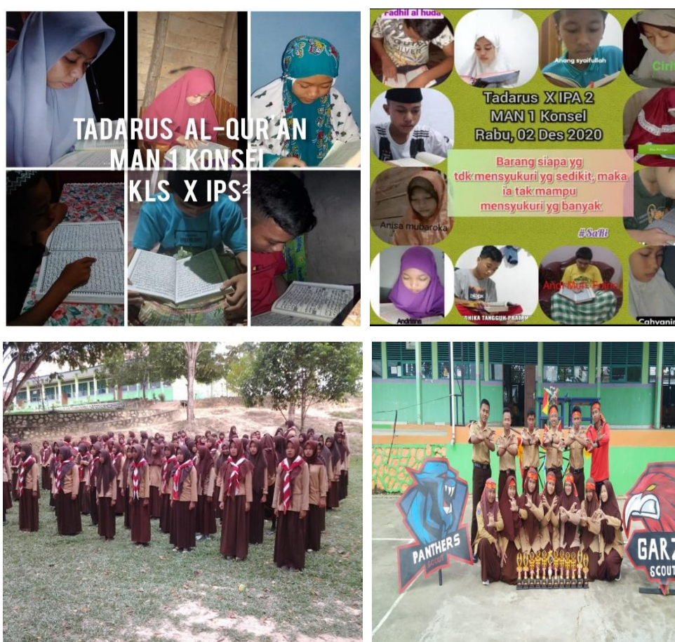
Gambar 1 Pembiasaan di MA Negeri 1 Konawe Selatan

Pembiasaan kepramukaan dilatihkan dalam rangka melatih kedisiplinan, kemandirian dan kerja sama.