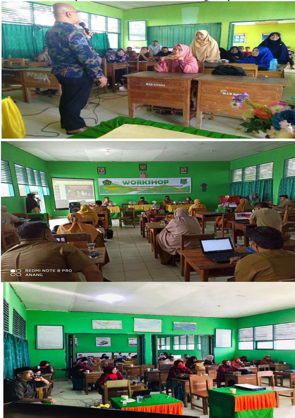
Gambar 2 Workshop dan Pembinaan Guru dan Tenaga Kependidikan