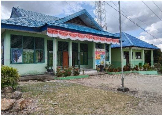
Gambar 5 Sarana dan Prasarana MA Negeri 1 Konawe Selatan

(sumber: arsip MA Negeri 1 Konawe Selatan)