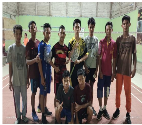
Mengenalkan olahraga untuk membiasakan pola hidup sehat dan sportivitas dalam olahraga.