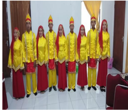
Mengenalkan kebudayaan nusantara dengan nuansa islami untuk membiasakan mencintai kebudayaan tanah air.